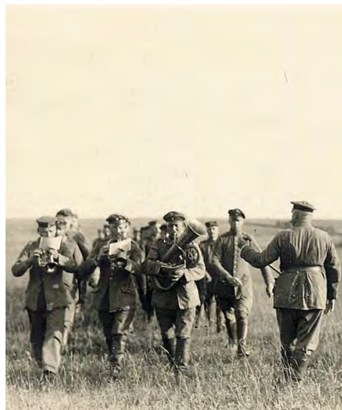
Una banda si esercita nelle pianure della Galizia